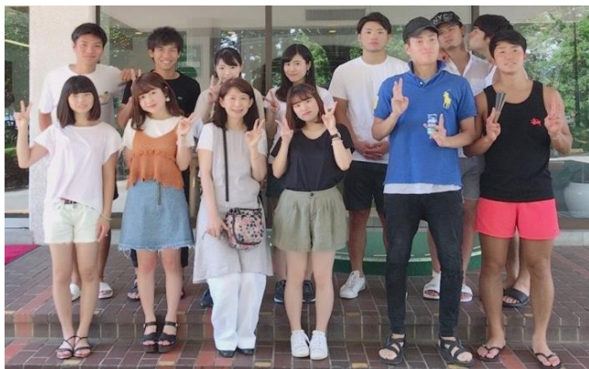
ゼミ合宿 in 静岡